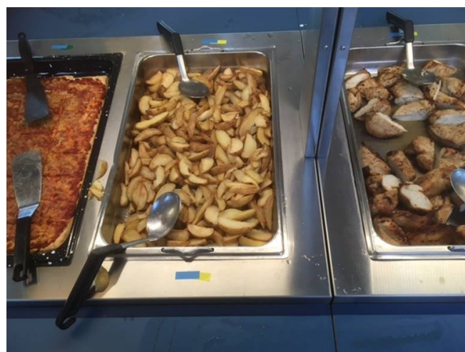
En del av godsakerna som serverades.