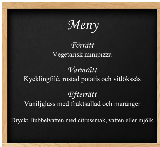
Festmenyn för invigningen av den nya matsalen hette duga!