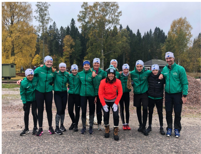
Trönös deltagare vid Kalla Champs.

håller skytteträning i samband med barmarksträningen på tisdagar.