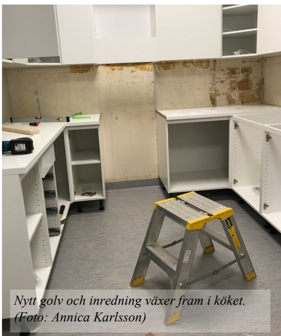
Nytt golv och inredning växer fram i köket.

Det började med att vi fick fasaden ommålad. När målningen i stort sett var klar så blev det dags för vårt kök att uppdateras. Det var ganska slitet och har varit svårt att hålla rent.