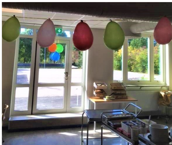
Klart för partaj! Den 7 september invigdes matsalen.

Under en lång period har Trönö skolas matsal renoverats och byggts ut. Den började renoveras i juni 2019 och stod färdigrenoverad i augusti 2020. Under tiden matsalen renoverades så fick Trönöeleverna äta mat från Norrtullskolan.