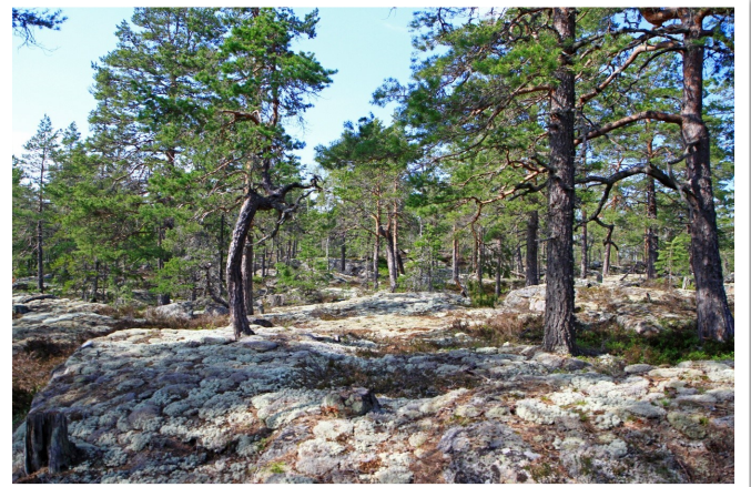
Gles tallskog med kala berghällar på reservatets högsta punkt vid norra delen.

Tallvitmossa , Sphagnum capillifolium , är vanlig i hållmarkstallskog och i sumpskog, myrmarker och klippbranter. Känns igen på sina stora täta svällande tuvor i röda, gröna och rosa nyanser. På Svartjärnsberget finns den på många ställen invid tallar i skrevor mellan stenblock och i gropar på hållmarken. Kuddarna och tuvorna med mossan ser mjuka och inbjudande ut att sätta sig och vila på, men då mossan innehåller mycket vatten blir man blöt i rumpan.