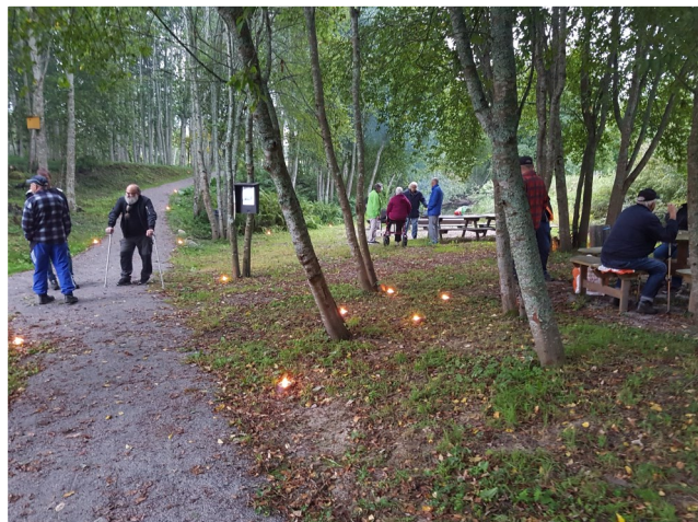
Från årets lyskväll, innan mörkret kommit.