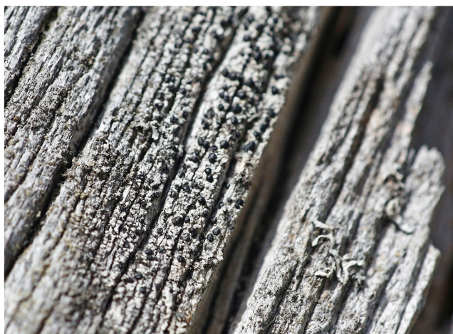
Ramboldia elabens , vedflamlav

Beskrivningen av Trönös senaste naturreservat fortsätter (del 1 i nr. 3/2019 och del 2 i nr. 2/2020.)