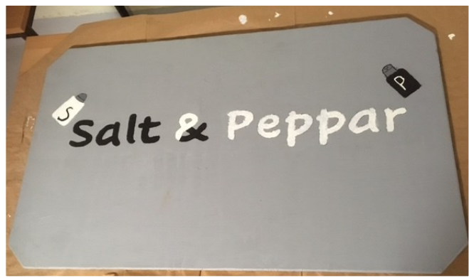
Nyttillverkad skylt med matsalens namn, framröstat av skolans elever.