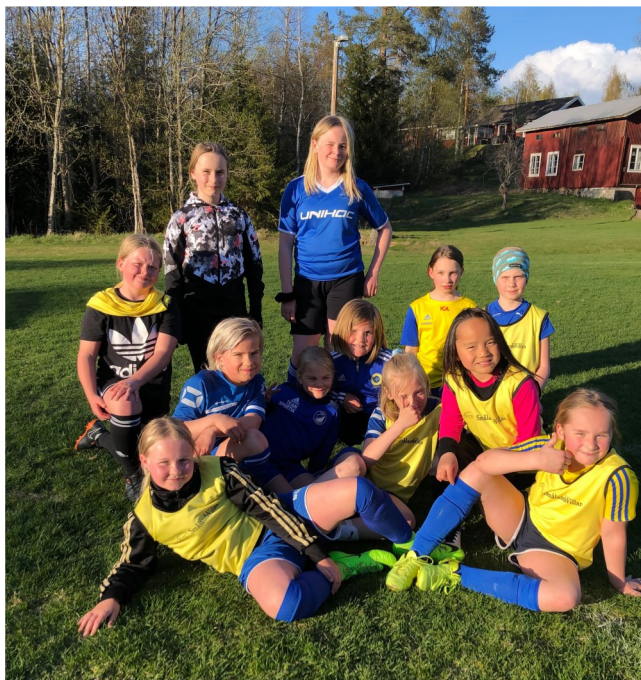
F10 har träning på Trönö IP.

Trönö IK erbjuder en mängd aktiviteter och vill locka fler till motion, rörelse och gemenskap.