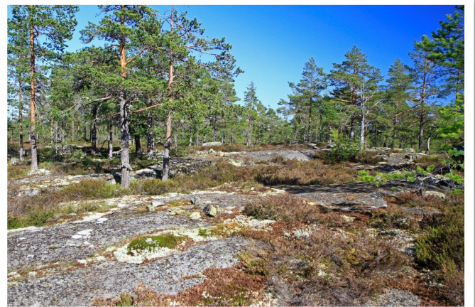
Miljöbilder från hållmarkstallskogen på toppen av Svartjärnsberget. Hällarna täckta med tuvor av främst renlav bland knottiga kortvuxna tallar.

Tuvad hedlav , Cetraria muricata , är en liten busklik lav med trinda, styvt uppstående, mörka bruna och glänsande lober. Den har placerats i en mängd olika släkten beroende på att den delar olika egenskaper med olika släkten. Laven förekommer över hela Sverige och växer på i små tuvor på marken eller mossiga stenar. Här växte den på torr hård tallved en gammal liggande tallstubbe med stenar runt rotbenen. Vid en koll på artportalen tillbaka till 1950 finns inga tidigare fynd inrapporterade från Hälsingland.