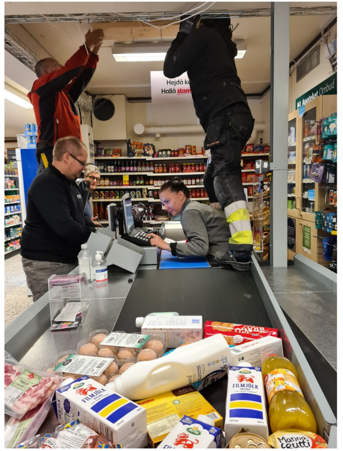
Allt går! I kassan servar Madicken kunderna, medan killarna från HP Bygg fixar något i taket.

Två verksamheter samtidigt - ICA-butik öppen som vanligt med normalt kundflöde, och ombyggnation med flera olika hantverkare och deras utrustning.