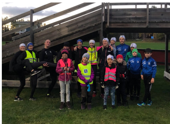
Barmarksträning på Trönö IP i oktober med våra skidungdomar.

Trönö IK deltar också i upprustningen av Hockeyrinken vid skolan. Vår träsarg har tagits ner och Söderhamns hockeys gamla sarg ska sättas upp. För tillfället görs markarbeten för att få en slät yta innan sargen kan sättas på plats.