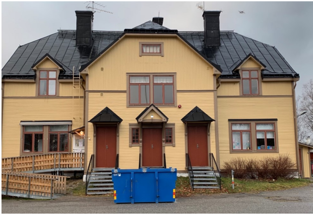
Nymålad fasad på det gamla skolhuset.

Hösten 2020 har varit full av hantverkare på förskolan.