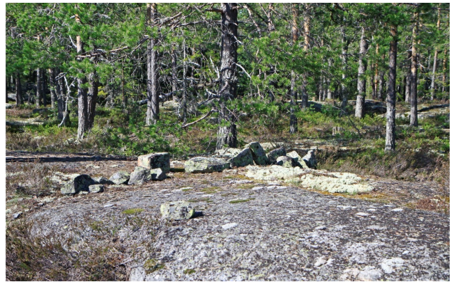
Anläggning för fågelfångst Svartjärnsberget. På den norra delen av reservatet 170 m/öH på två plana öppna hållmarker finns lämningar efter äldre tiders metod för fångst av skogs-fågel orre och tjäder.

I nästa nummer av Trönöbygden avslutas Alf Pallins gedigna inventering av Svartjärnsberget med en rapport från ett återbesök hösten 2018.