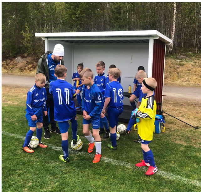
Samling med P10 innan match på Trönö IP.

Fotbollen har satt punkt för säsongen, vi har haft fler lag i seriespel, en del av dessa i samarbete med andra föreningar i vår närhet. Herrlaget startade under året upp ett samarbete med Norrala i div 6. Trönös F17 fortsätter sitt samarbete med Rengsjö och Trönös P12/13 spelade tillsammans med Enånger. I åldern P10/F10 hade vi lag i egen regi samt ett knattelag.