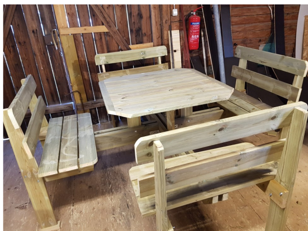
Gedigna och välgjorda trämöbler för trädgården kan tillverkas på beställning!

Övriga arbeten har varit att snickra fler bänkar/bord som är beställda. För dig som önskar beställa är det bara att säga till.