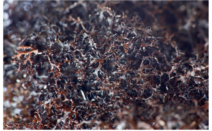
Cetraria muricata , tuvad hedlav