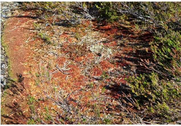
Sphagnum capillifolium , tallvitmossa