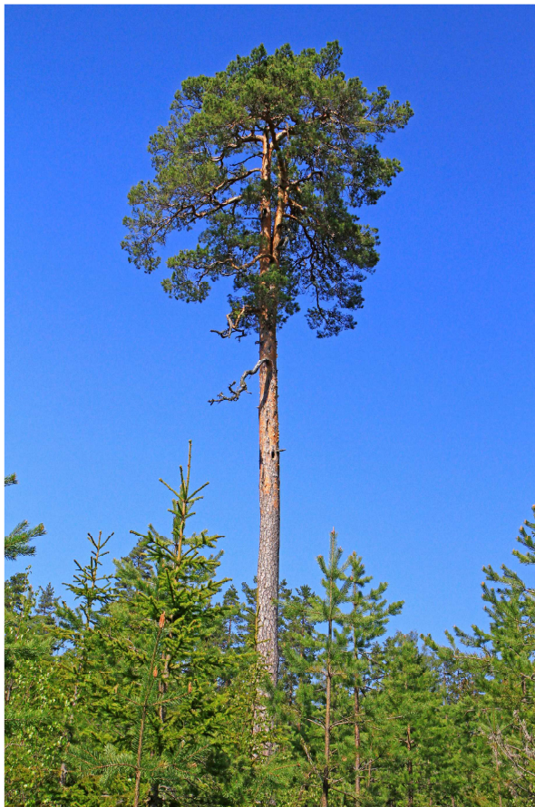
Det är den här ståtliga vackra tallen i kanten mellan ungskogen och reservatets början som du skall ta sikte på när du vandrar upp för slutningen.

På hygget hade man sparad några lite äldre aspar som med tiden kan bli lämpligt substrat för diverse lavar och kanske också boplats för hackspett. Signalarten Leptoginum saturninum , skinnlav, såg vi på flera av aspstammarna. En sparad gammal tallöverståndare, vacker och ståtlig med bohål efter hackspett, står ensam kvar bland den uppväxande ungskogen. Den tar vi sikte på när vi går över slutningen upp mot området till reservatet.