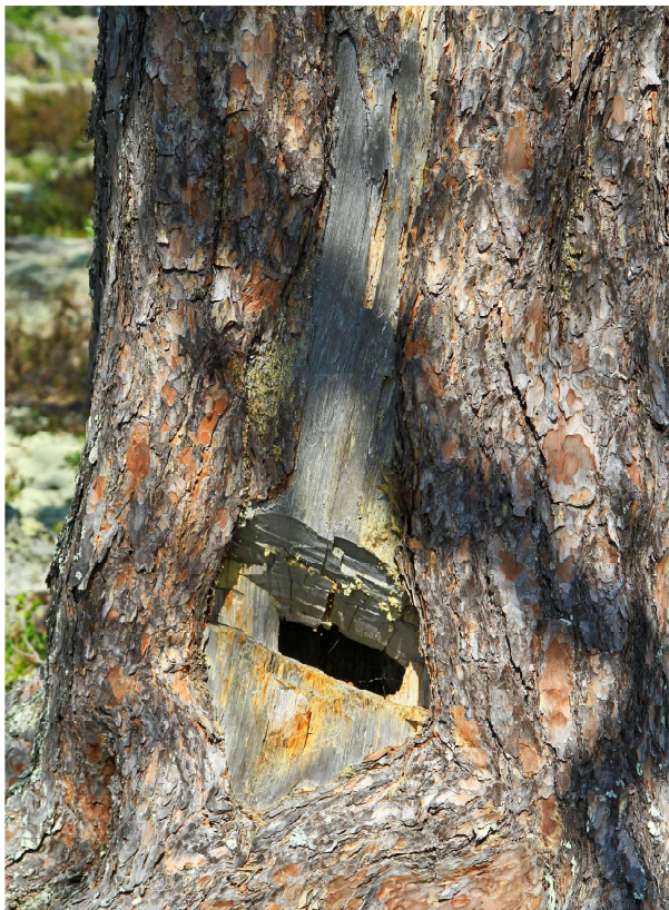
Exempel på yxhugg i stambasen från dimensionsavverkningens tid i slutet på 1800-talet, före att kolla om trädet är rötat. Fanns centrumröta som i exemplet på bilden, lämnades trädet kvar. Jag kunde se flera tallar med dessa huggmärken.