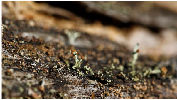
Som exempel på en av de många tallägorna hittade jag den rödlistade lilla laven dvärgbägarlav.