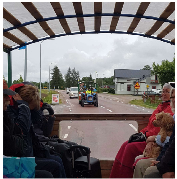
Tur att det finns tak över vagnarna när man far ut på regnig traktorfärd. Denna gick genom Rappsta, men stoppen blev färre än tänkt på grund av väderleken.

Årets byafärd som delvis spolierades av regn skedde i början av juli, med boksläpp av Boken om Rappsta och Gynberg . Byaböckerna tenderar att bli allt mera innehållsrika och tjocka tack vare engagerade bybor som delger gårdshandlingar, fotografier och berättelser.