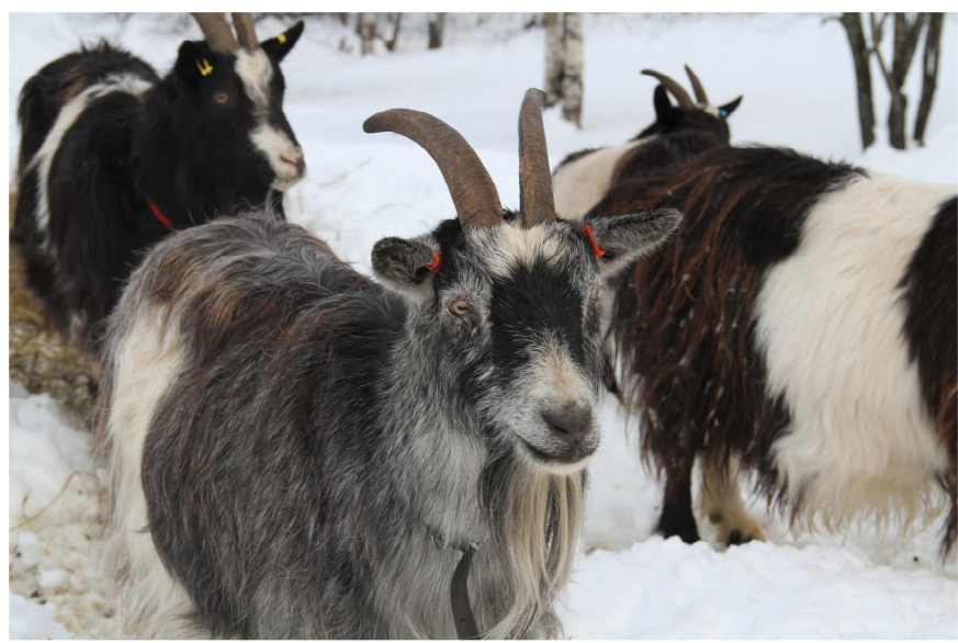
Getter är nyfikna och duktiga på att hålla utmarker rena från busk och sly.